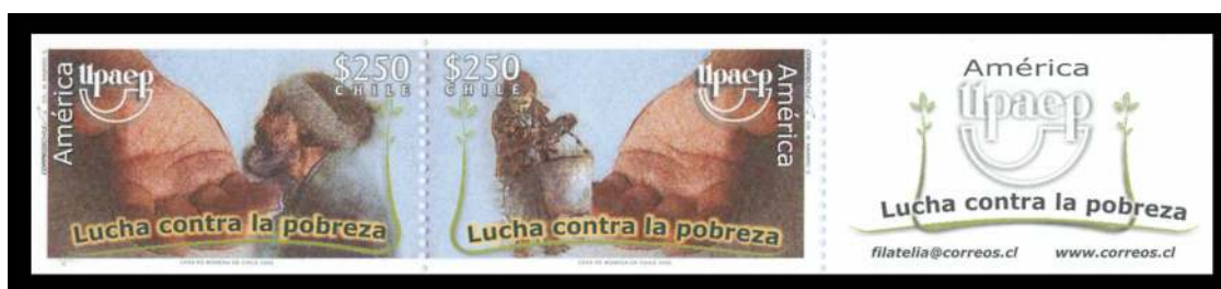
2164 - 2165 - VIÑETA