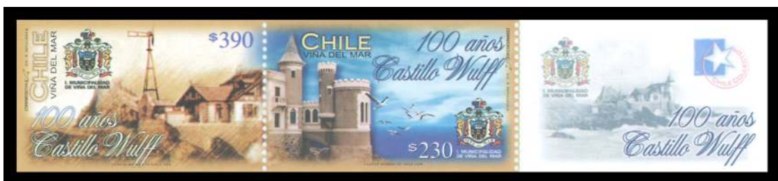
2174 - 2175 - VIÑETA