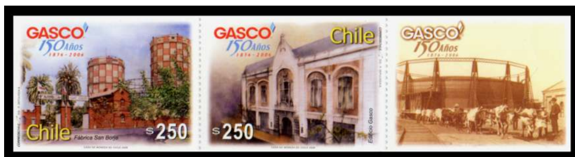
2202 - 2203 - VIÑETA