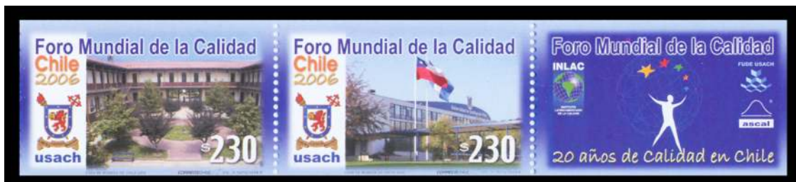
2188 - 2189 - VIÑETA