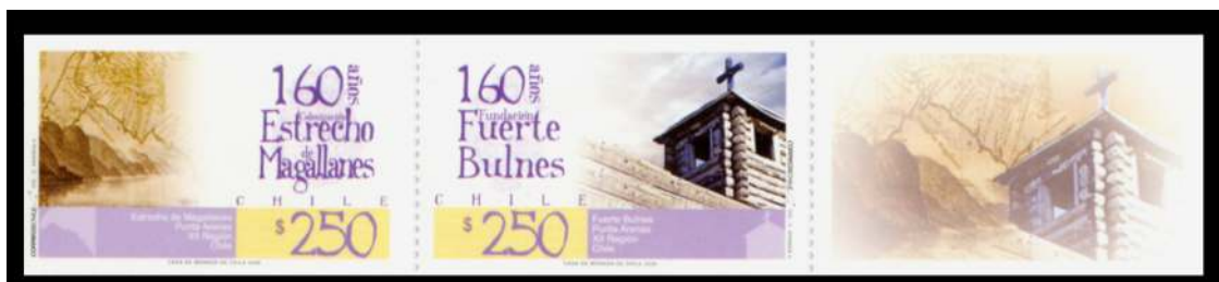
2200 - 2201 - VIÑETA