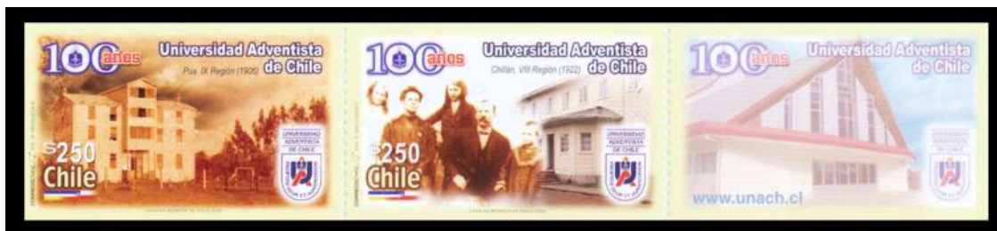
2194 - 2195 - VIÑETA