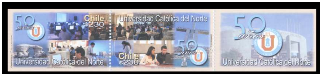
2185 - 2186 - VIÑETA